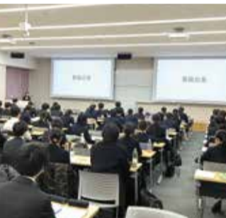
進路サポートシステム「花☆サポ」 スマートフォンやパソコンから、求人やインターンシップの検索、個別相談・支援講座参加の予約、各マナーシートのダウンロード、就活準備動画閲覧など、就職活動に必須のシステムです。

2025年3月卒の学生にとって本格的な就職活動開始直前となる2月には、就活サポート講座と就職説明会を開催し、就活の流れやマナー、履歴書の書き方、求人情報の見方などの基本的な内容の講座に加え、本学と連携しているサポート機関や各業界の企業・団体を迎え、サポート概要紹介や業界・企業研究会を開催しました。さらに、オンラインでの説明会・面接を想定した対策講座も開催しました。4月以降は、進路就職状況調査を行い、電話での個別サポートや、ゼミ担当教員と連携した個別対応をメインにサポートを続けます。