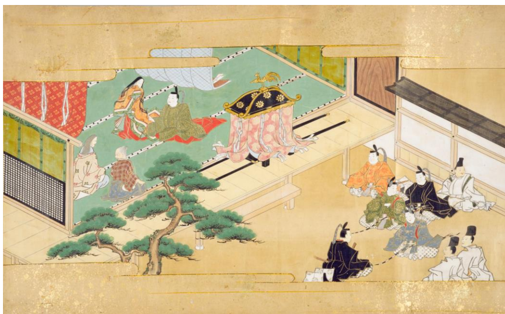
国立国会図書館蔵『竹取物語絵巻』 (帝とかぐや姫の対面)