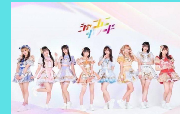
シャニムニ=パレード