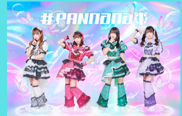
#PANnana -パンダの指は実は7本ある-