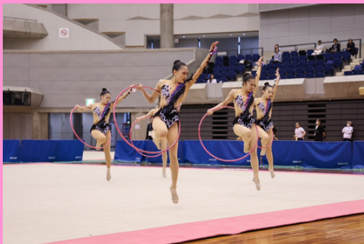
花園大学新体操部